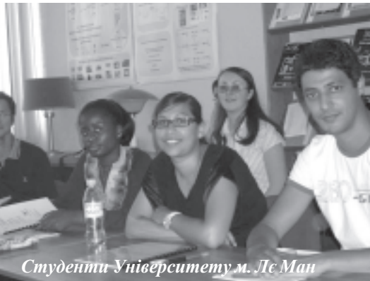
Студенти Університету м. Ле Ман

Міжнародна політика ХТФ полягає в забезпеченні умов вільного вибору людини у здобутті знань найвищої якості та їх передачі. Стратегічною метою міжнародної діяльності є формування позитив-