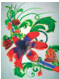
“Кураж” Лілія Руссу

Оксана Васильченко: «Я вирішила приєднатися до гуртка, тому що мені подобається фотографувати і фіксувати миті нашого мінливого життя. У своїх роботах я намагаюся розкрити своє бачення світу, звернути увагу на те, що непомітно з першого погляду».