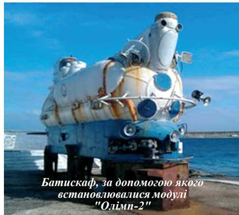
Батискаф, за допомогою якого встановлювалися модулі "Олімп-2"

Робота на посту випромінювання є дуже складною як в інтелектуальному, так і у фізичному плані. Інтелектуальна робота полягає в тому, що слід тримати в голові всі налаштування і знати функції кожного приладу, не переплутати ніяких підключень та комутацій, виконувати вимоги головного конструктора. Для роботи на цьому посту використовуються абсолютно всі знання з дисциплін, які викладали мені в університеті, – теорії електричних кіл, обробки сигналів, електроакустичних перетворювачів, акустичних антен. У фізичному плані важко в тому сенсі, що всі прилади разом мають доволі значну вагу (окремі перетворювачі важать до 90 кг), і пересувати їх досить важко. Крім того, випробування відбуваються не день і не два, іноді зовсім без сну, до того ж – у відкритому морі. Проте з точки зору набуття практичних навичок і досвіду участь у них є безцінною, адже довелося не лише мати справу з реальними проектами і виробами, але й пліч-о-пліч співпрацювати з військовими, та ще й у специфічних корабельних умовах. Мати змогу спілкуватися з людьми, які все життя займаються речами, яких мене вчили в університеті, почути опові-