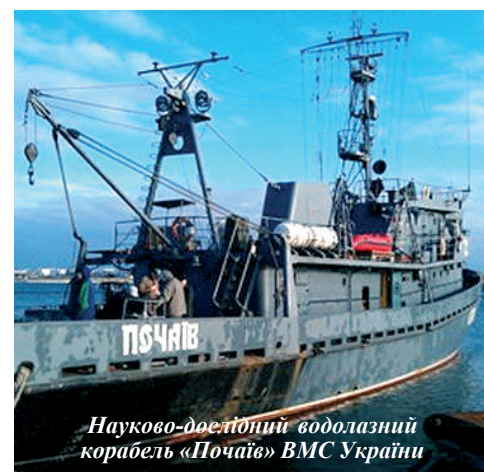
Науково-дослідний водолазний корабель «Почаїв» ВМС України

Також були проведені успішні випробування роботи оновлених РГБ для протичовнового літака Ту-142, зокрема перевірка роботи радіо-