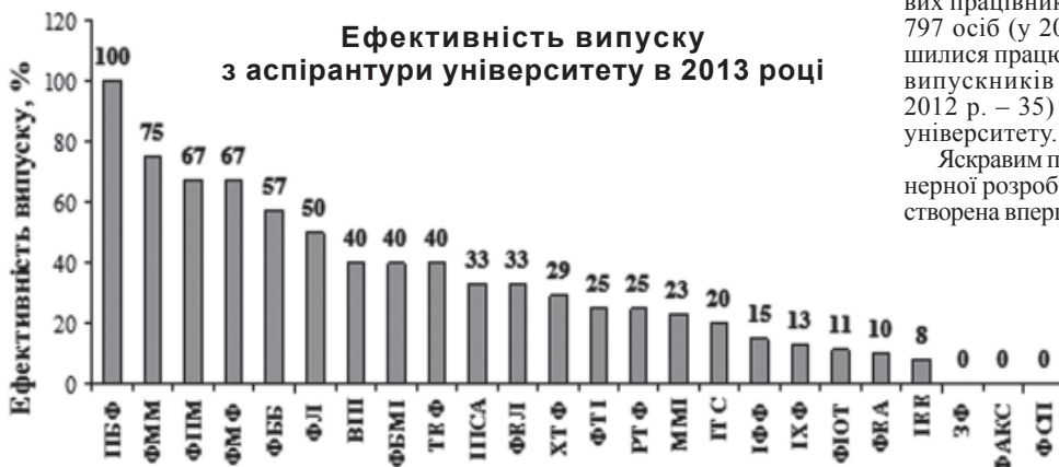
Ефективність випуску з аспірантури університету в 2013 році

2013 р. – 24,5 млн грн, 2014 р. – 20,8 млн грн.