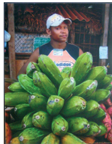
«Подорож на острів мрій»