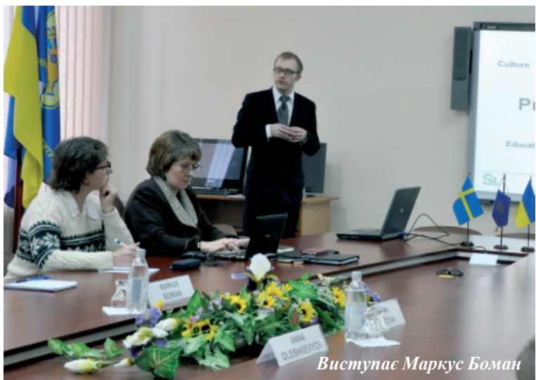
Виступає Маркус Боман

23 січня НТУУ «КПІ» відвідав менеджер міжнародних програм Шведського Інституту Маркус Боман. Гість ознайомився з історичною частиною кампусу університету, оглянув експозицію Державного політехнічного музею України при НТУУ «КПІ» та зустрівся з керівництвом університету.