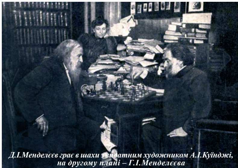
Д.І.Менделєєв грає в шахи з видатним художником А.І.Куїнджі, на другому плані – Г.І.Менделєєва

Традиція таких зустрічей збереглася і після одруження Дмитра Івановича і Ганни Іванівни. До їх гостинного будинку приходили найвидатніші тогочасні російські митці – Ілля Рєпін, Іван Крамской, Іван Шишкін, Микола Ярошенко, брати Віктор і Аполлінарій Васнецови, Василь Суриков, Григорій Мясоедов, Ілля Остроухов, Михайло Савицький, Володимир Маковський, скульптор Леонід Позен, відомий мистецтвознавець Адриан Прахов та багато інших. Але особливу приязнь він відчував до видатного майстра пейзажу Архипа Куїнджі, дружба з яким тривала кілька десятиліть до самої смерті вченого.