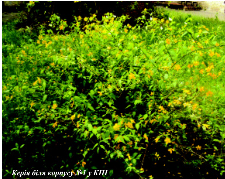
Керія біля корпусу №1 у КПІ