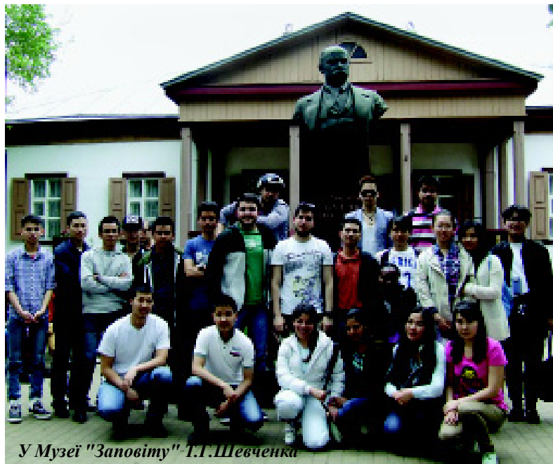
У Музеї "Заповіту" Т.Г.Шевченка

Ландшафт Київської політехніки стає все красивішим і привабливішим: з'являються нові елементи, насадження і композиції. Радує весняна квітуча палітра. Здавалося б, уже всі гарні куточки відвідали, дослідили і сфотографували.