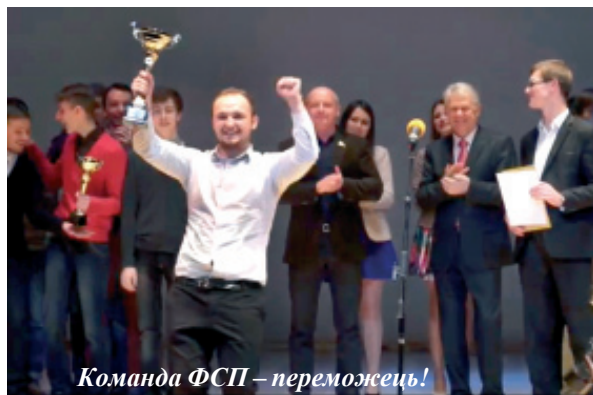
Команда ФСП – переможець!

Після фінального конкурсу в залі здійнявся шквал оплесків! Глядачі не хотіли відпускати веселих та найкмітливіших зі сцени.