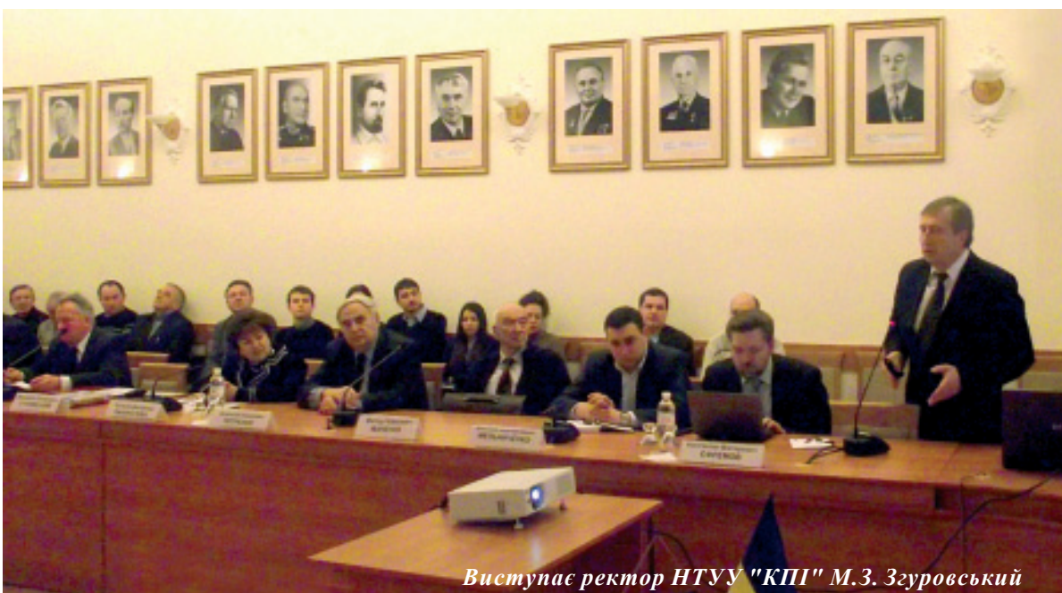
Виступає ректор НТУУ "КПІ" М.З. Згуровський

30 січня в НТУУ "КПІ" відбувся науковий семінар "Системні дослідження в науках про Землю, економіку та суспільство 2015".