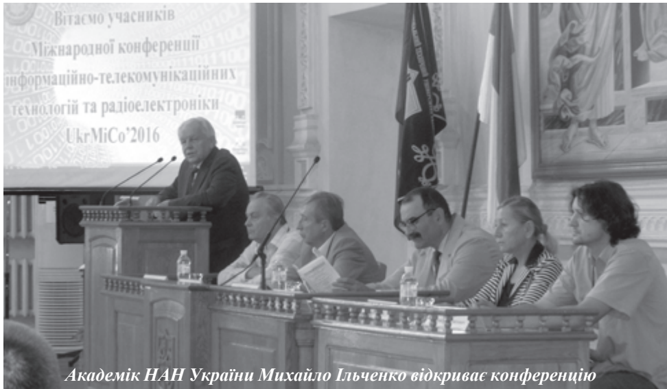
Академік НАН України Михайло Ільченко відкриває конференцію

об'єднує провідних українських науковців галузі та представників зарубіжних університетів з 7 країн світу і транснаціональних компаній.