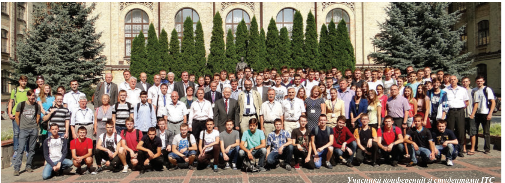
Учасники конференції зі студентами ІТС