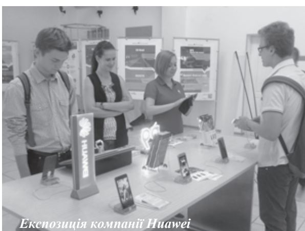
Експозиція компанії Huawei

"Я впевнений, що спільно ми виховуватимемо висококваліфікованих фахівців для компанії Huawei, для України, і для всього світу", – наголосив наприкінці церемонії ректор університету академік НАН України Михайло Згуровський.