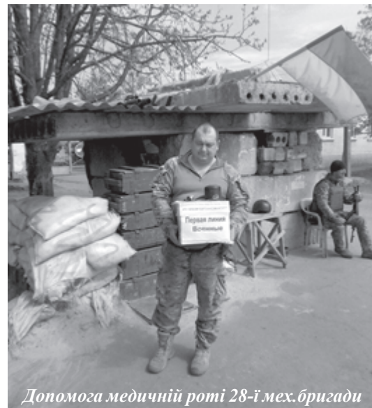
Допомога медичній роті 28-ї мех.бригади

– На прохання військових медиків надрукували у видавництві "Політехніка" 1000 примірників медичного посібника, який є необхідним на фронті, – "Домедична допомога пораненим в умовах бойових дій".