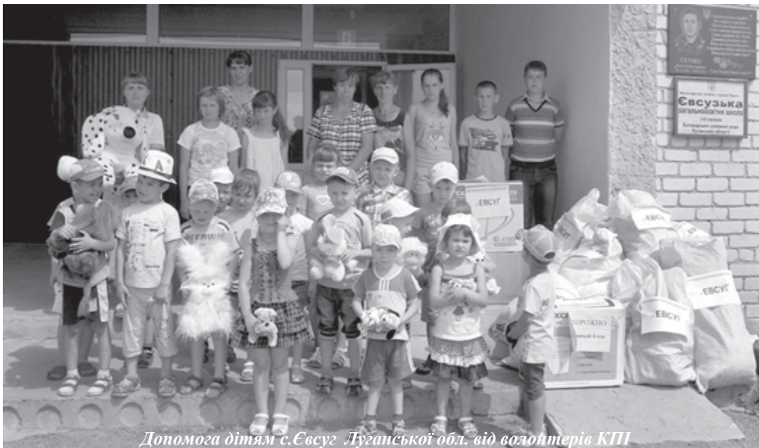
Допомога дітям с.Євсуг Луганської обл. від волонтерів КПІ