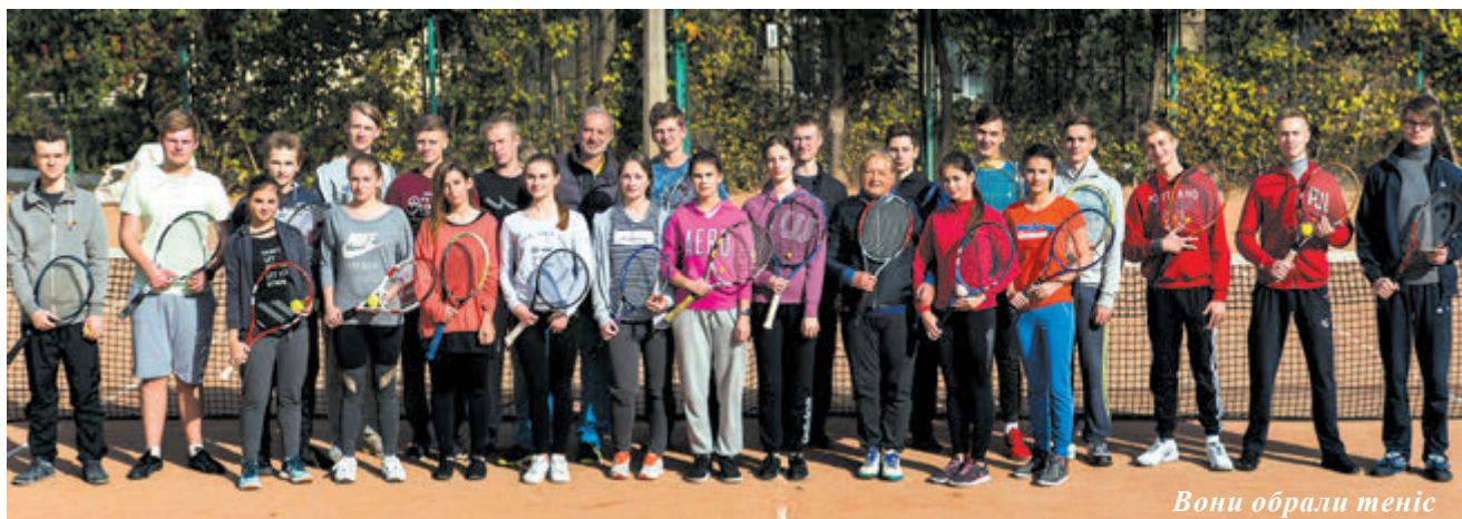
Вони обрали теніс

Инф. кафедри фізвиховання ФБМІ, відділення тенісу