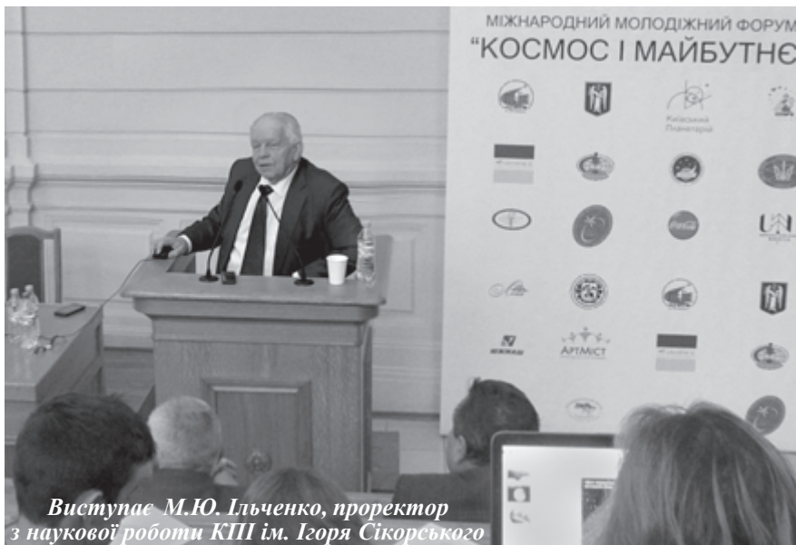
Виступає М.Ю. Ільченко, проректор з наукової роботи КПІ ім. Ігоря Сікорського

навчальних закладів – були наочною ілюстрацією того, як втілюються у життя ідеї такої освіти. Особливу увагу учасників у цьому контексті привернув виступ проректора з наукової роботи КПІ ім. Ігоря Сікорського академіка НАН України Михайла Ільченка. Він презентував Космічну програму університету й докладно розповів про розроблені київськими політехніками перші вітчизняні наносупутники "PolyITAN-1" і "PolyITAN-2-SAU", які сьогодні долають все нові й нові тисячі кілометрів на навколоземній орбіті, та про космічні апарати і проекти, що нині перебувають у роботі.