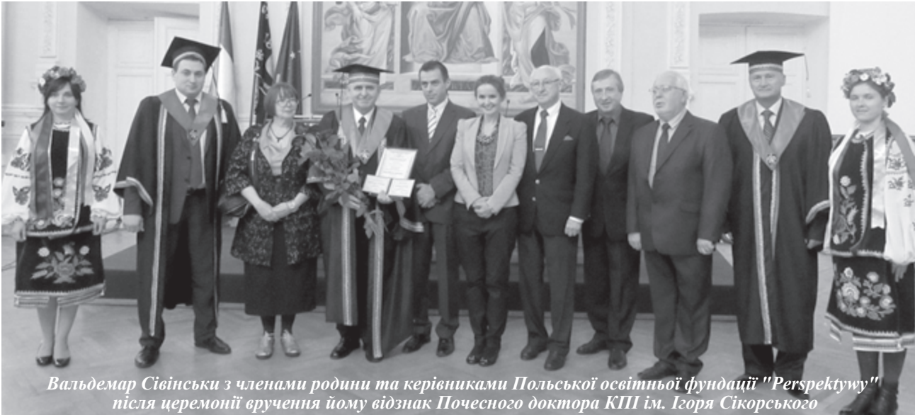
Вальдемар Сівінський з членами родини та керівниками Польської освітньої фундації "Perspektywy" після церемонії вручення йому відзнаки Почесного доктора КПІ ім. Ігоря Сікорського

розвиток". Ця угода відзначає особливу роль університетів у формуванні політики сталого розвитку та спільної діяльності за цим напрямом, а також необхідність наполегливо пропонувати урядам Республіки Польща та України використовувати результати досліджень сталого розвитку задля управління розвитком на різних рівнях (країни, регіону, території), інтенсифікувати академічні обміни між університетами Респуб-