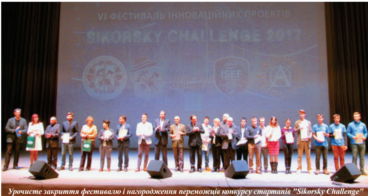
Урочисте закриття фестивалю і нагородження переможців конкурсу стартапів "Sikorsky Challenge"

У Національному технічному університеті України "Київський політехнічний інститут імені Ігоря Сікорського" вшосте відбувся традиційний Всеукраїнський фестиваль інноваційних проєктів "Sikorsky Challenge".