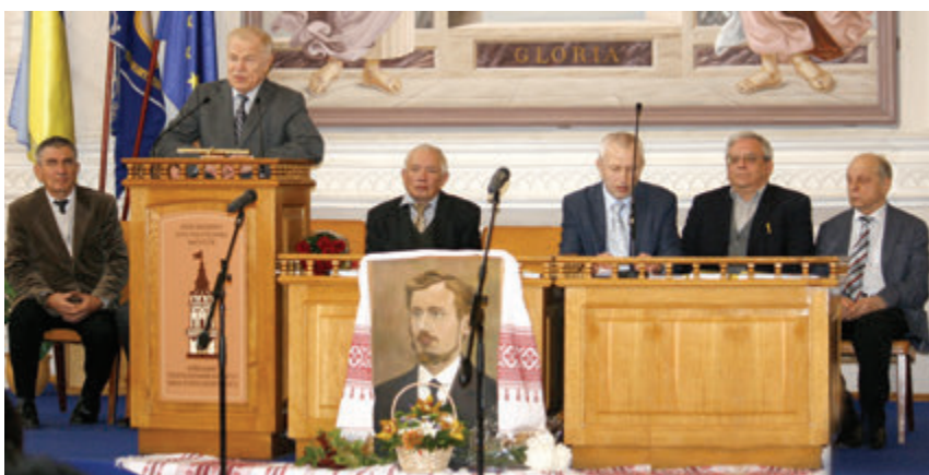
Академік НАНУ Ю.І. Якименко вітає учасників урочистого засідання

7–10 жовтня 2017 року в Східноєвропейському національному університеті (СНУ) імені Лесі Українки (м. Луцьк) та КПІ ім. Ігоря Сікорського пройшла XVIII Міжнародна наукова конференція імені академіка Михайла Кравчука. Вона була присвячена 125-й річниці від дня його народження. У конференції взяли участь більше 200 учасників (155 доповідей) із 8 країн (Україна, Білорусь, Росія, Польща, Чехія, Німеччина, Азербайджан, Узбекистан).