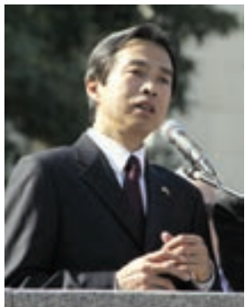
Надзвичайний і Повноважний Посол КНР в Україні Ду Вей

1 жовтня весь Китай відзначає своє головне державне свято – День утворення Китайської Народної Республіки. Цього дня в 1949 році на велелюдному мітингу, що зібрався на площі Тяньаньмень у Пекіні, було оголошено про постання нової держави. Урочистості проходять по всій країні та в її іноземних представництвах в усьому світі. З цього дня в Китаї починається один з двох "Золотих тижнів" (другий припадає на Свято весни), коли святкові дні (1–3 жовтня) об'єднують