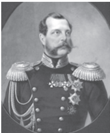
Імператор Олександр II Портрет роботи М. А. Лаврова (1868 р.)

З 1923 року працював на дипломатичній роботі. У 1927 році Х. Раковський як лідер лівої опозиції був виключений з партії більшовиків і відправлений у заслання до Астрахані. Утім, після покаянного листа Сталіну, у 1934 році він повернувся в Москву. 31 грудня 1936 року колишнього голову Раднаркому УРСР було заарештовано. Наступного року він був засуджений до 20 років тюремного ув'язнення. У вересні 1941 року під час наближення гітлерівців до Орла, де в місцевій тюрмі відбував покарання Християн Раковський, його разом з іншими політв'язнями розстріляли.