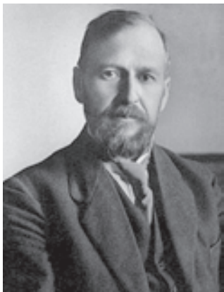
Голова Ради народних комісарів УРСР Християн Раковський

базі КПІ було створено вісім самостійних галузевих інститутів: машинобудівний, енергетичний, хіміко-технологічний, авіаційний, інженерно-будівельний, інженерів залізничного і водного транспорту, легкої промисловості, харчової промисловості.