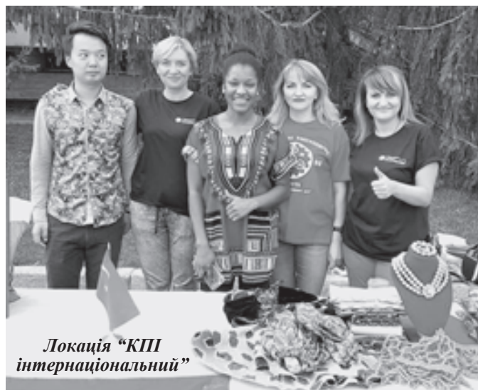
Локація "КПІ інтернаціональний"

Особлива вдячність висловлюється підприємствам, установам, організаціям, що підтримали фестиваль, а саме: ПАТ "Слов'янські шпа-