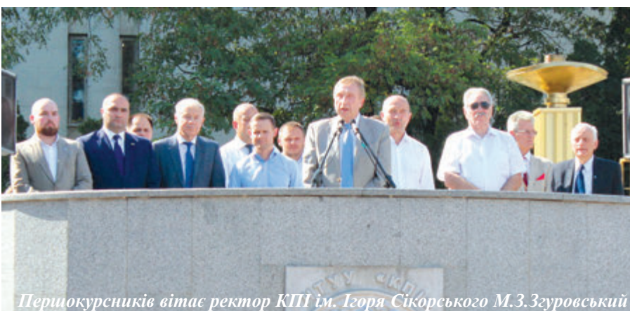
Першокурсників вітає ректор КПІ ім. Ігоря Сікорського М.З.Згуровський

зв'язку та захисту інформації КПІ ім. Ігоря Сікорського – відмінником навчання.