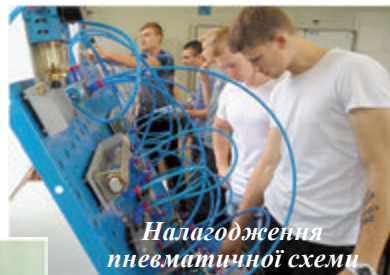
Налагодження пневматичної схеми

На навчання прибули студенти із дев'яти різних ЗВО України: Вінницького національного технічного університету, Національного універ-