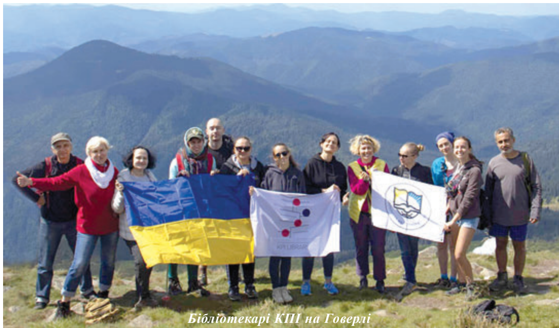
Бібліотекарі КПІ на Говерлі

І ось вершина – "дах України". Ми достойно завершили сходження, розгорнувши три