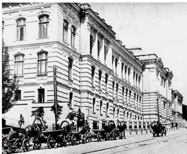
Будівля Першого комерційного училища, де починав свою роботу КПІ (стара листівка)