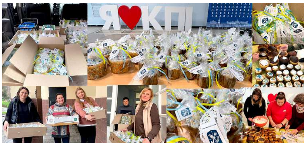
Вітання до Великодня постраждалим жителям м. Бородянка

– Підприємницький талант викладачів факультету менеджменту та маркетингу завдяки вирішенню завдань логістики допоміг забезпечити налагодження системи управління