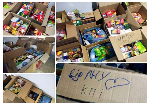
Гуманітарна допомога від ЛНУ ім. Івана Франка