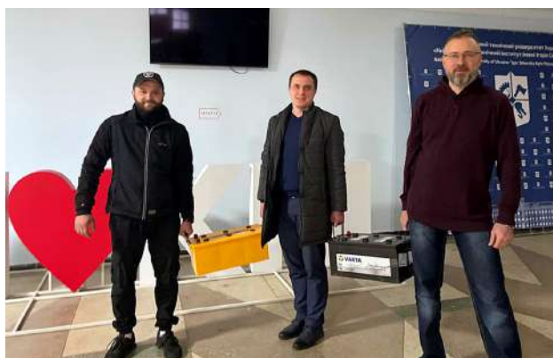
Акумулятори, придбані коштом благодійників для потреб університету

Частина допоміжного і адміністративного персоналу не мали змоги виходити на роботу через евакуацію або заблокованість у місцях проживання внаслідок бойових дій. І тут неможливо не захопитися згуртованістю студентів, їх здатністю до функціональної взаємодії. Значною мірою саме завдяки їм вдалося забезпечити функціональність гуртожитків, жодний з яких не закритися ні на день, а також дотримання порядку і безпеки в укриттях.