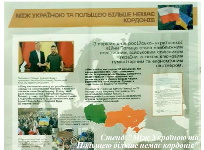
Стенд "Між Україною та Польщею більше немає кордонів"

Вражає експонована на одному зі стендів світлина учасників з'їзду організації випуск-