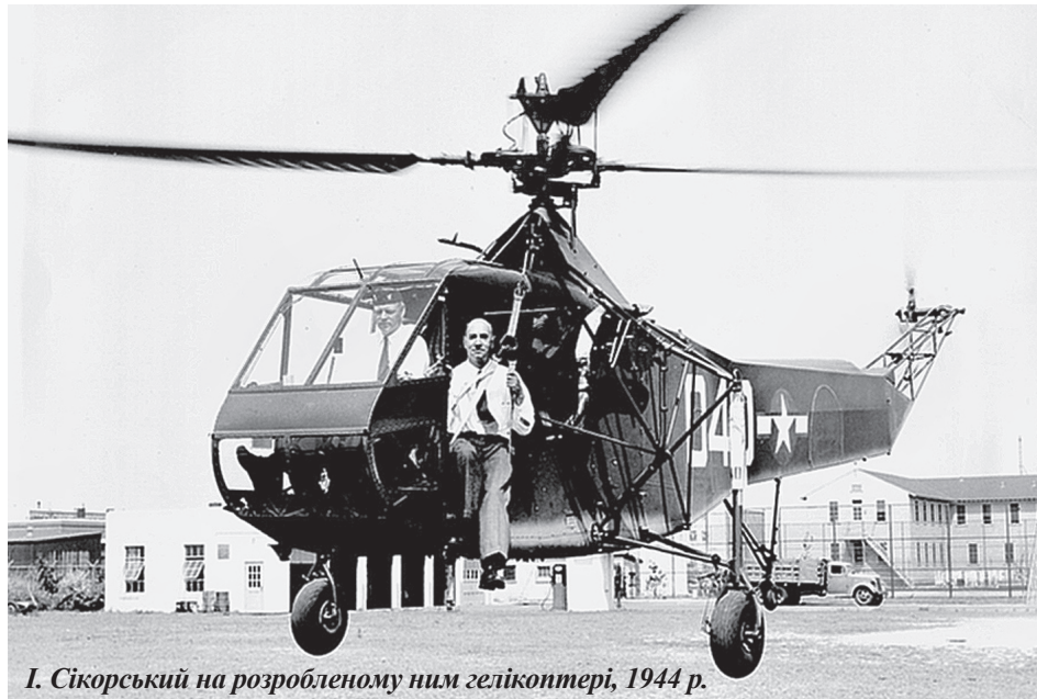
І. Сікорський на розробленому ним гелікоптері, 1944 р.

Свій перший у житті літальний апарат – гелікоптер – Ігор Сікорський розпочав проектувати влітку 1908 року. Дослідження він проводив на території батьківської садиби. Юному винахідникові бракувало досвіду і коштів на придбання потужного мотора. А вже деякі комплектні деталі до льотних апаратів, зокрема мотори "Анзани", доводилося закуповувати у Парижі, на той час всесвітньому центрі авіації. Тож його першими спонсорами стали батько Іван Олександрович та сестра Ольга. Невдовзі Ігор ус-