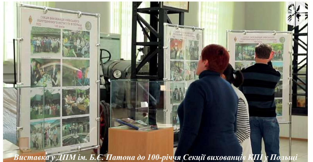
Виставка у ДПМ ім. Б.Є. Патона до 100-річчя Секції вихованців КПІ у Польщі

Війна, яку розв'язала росія проти нашої країни, остаточно прояснила, хто є лютим ворогом України, а хто – її справжнім другом. І серед найближчих і найвірніших друзів – Польща, яка прихистила мільйони (!) наших співвітчизників та постійно допомагає нашій країні як з постачанням сучасних озброєнь, так і з забезпеченням багатьма речами, які значно полегшують сьогоденне життя українців. Зв'язки між нашими народами сягають сивої давнини, і хоча вони не завжди були абсолютно безхмарними, сьогоденні випробування засвідчили, що для поляків поняття "братерство народів" не є порожнім звуком.