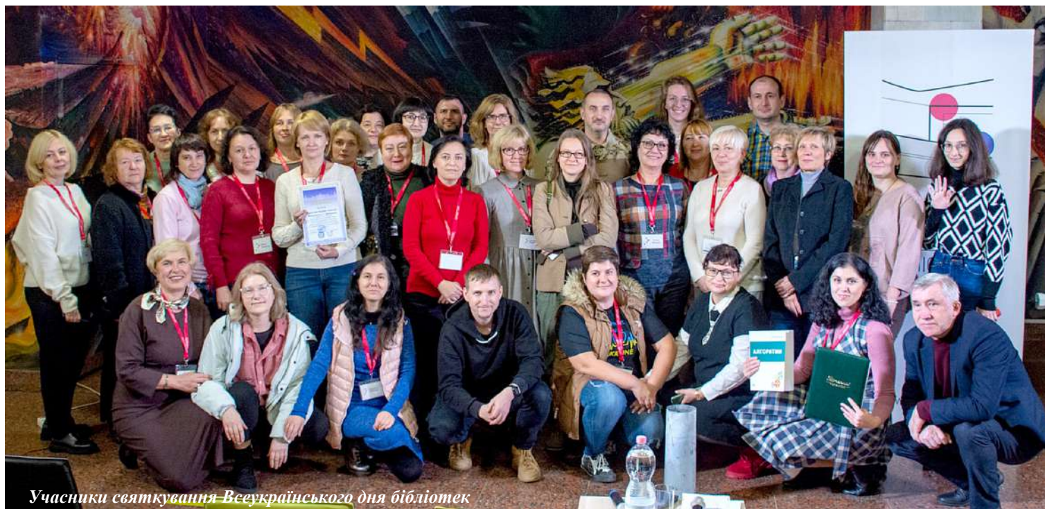
Учасники святкування Всеукраїнського дня бібліотек