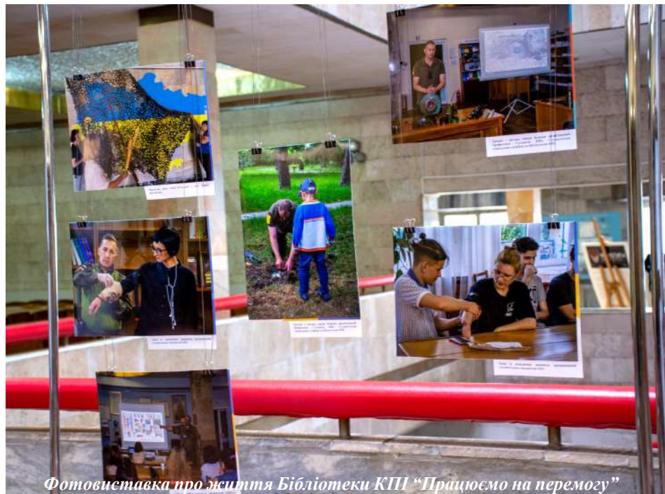
Фотовиставка про життя Бібліотеки КПІ "Працюємо на перемогу"

В останній день вересня НТБ ім. Г.І. Денисенка відзначила Всеукраїнський день бібліотек. Гасло цьогорічного святкування – "Бібліотека Незламна", безперечно, дуже актуальне в умовах жорстокої загарбницької російсько-української війни. Водночас, саме наприкінці вересня працівники книгозбірні звільняли підвальні приміщення для облаштування там сучасного укриття "Smart Shelter". Адже нині бібліотекарі мають не лише працювати з читачами за усіма традиційними для бібліотеки напрямками, але й забезпечити збереження їхнього життя. Так, власне, як і свого.