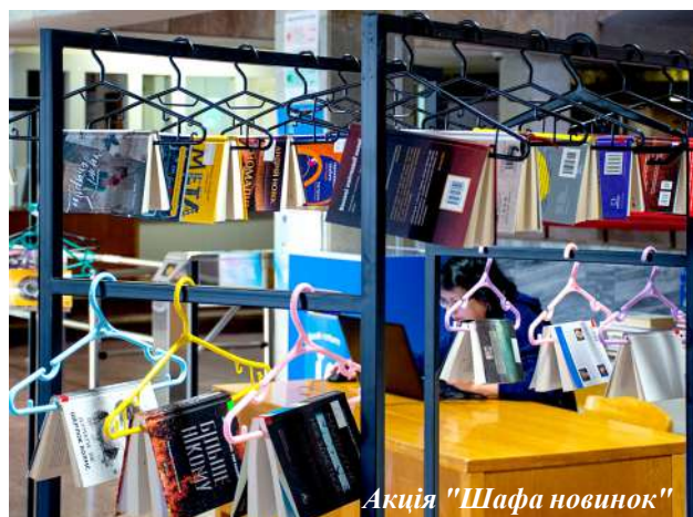
Акція "Шафа новинок"

Пошукова система Каталог+, яку також нещодавно впроваджено, дозволяє користувачам одночасно шукати матеріали за обраною тематикою у багатьох джерелах: серед друкова-