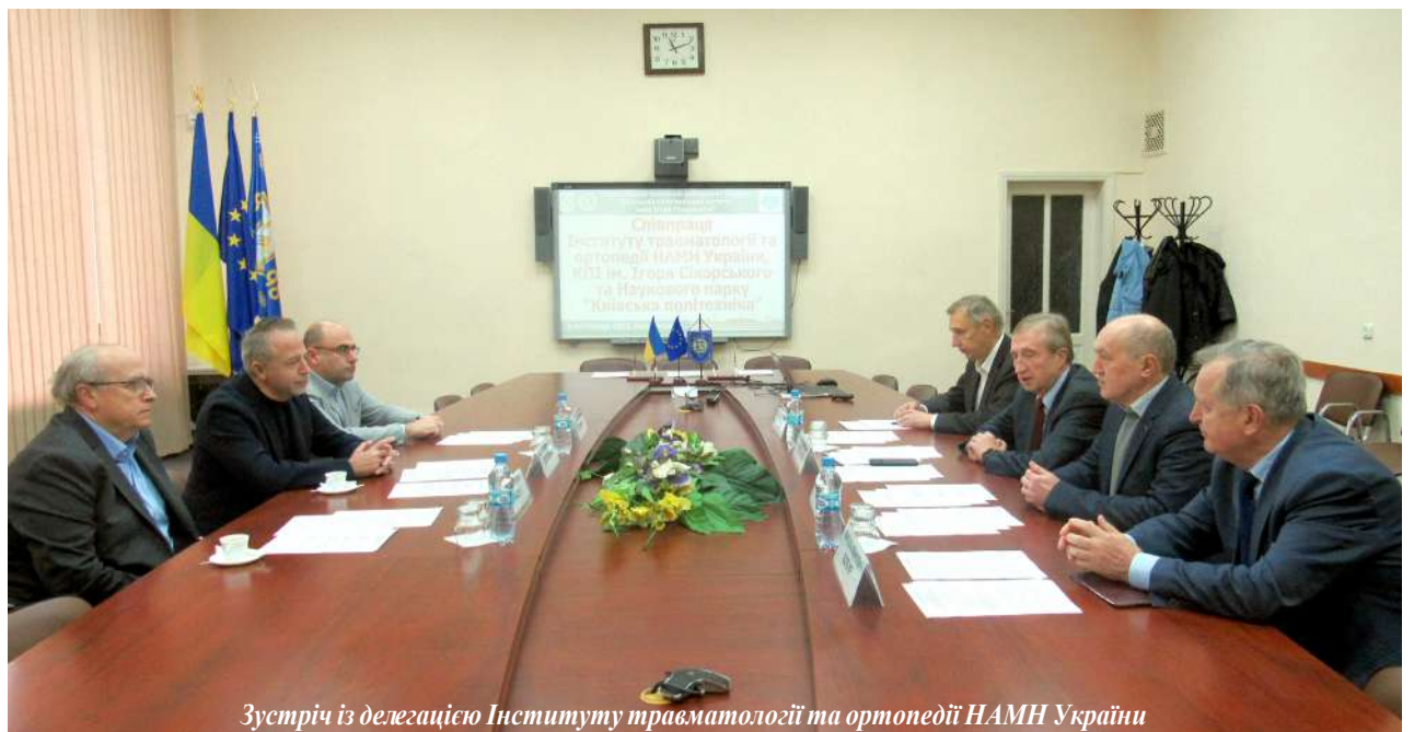
Зустріч із делегацією Інституту травматології та ортопедії НАМН України

Питання якісного лікування та реабілітації українських воїнів, які зазнали на фронті поранень чи бойових травм, стає дуже нагальним. Тисячі здебільшого молодих людей, які мужньо захищали Україну у війні з жорстокою ординською навалюю зі сходу, необхідно повертати до повноцінного життя. І сучасна медицина демонструє, що інколи може творити для цього справжні дива. Щоб такі дива стали, як кажуть медики, "золотим стандартом" їхньої роботи, їм допомагають представники різних наукових галузей. КПІ в цьому плані має величезний потенціал. Тому й активізує останнім часом свою співпрацю з провідними науково-медичними закладами нашої країни.