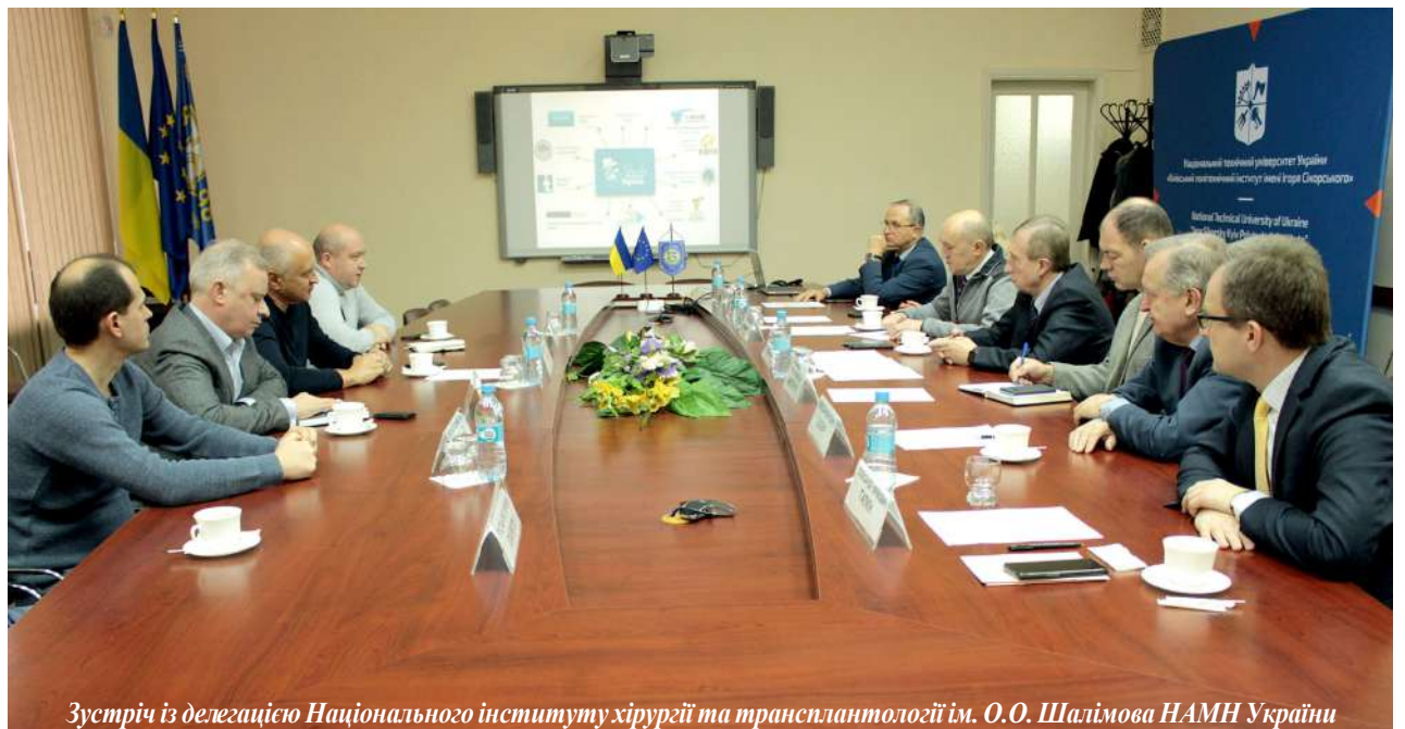
Зустріч із делегацією Національного інституту хірургії та трансплантології ім. О.О. Шалімова НАМН України