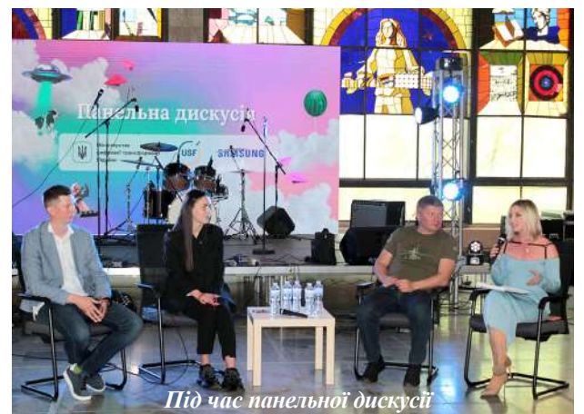
Під час панельної дискусії