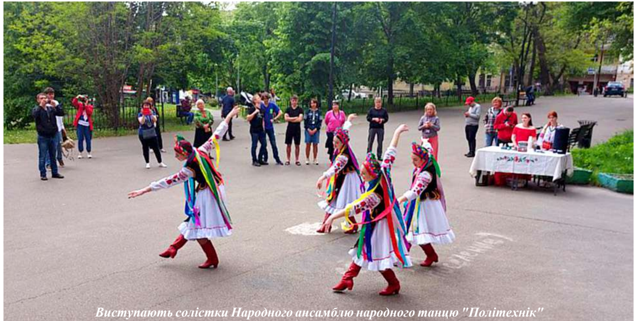
Виступають солістки Народного ансамблю народного танцю "Політехнік"

лився зі слухачами переживаннями, що линуть з власної душі.