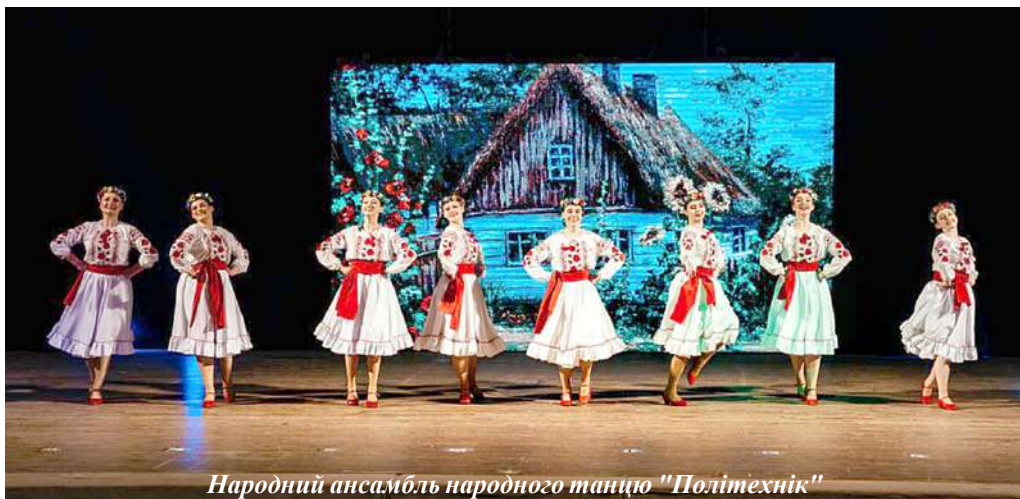
Народний ансамбль народного танцю "Політехнік"