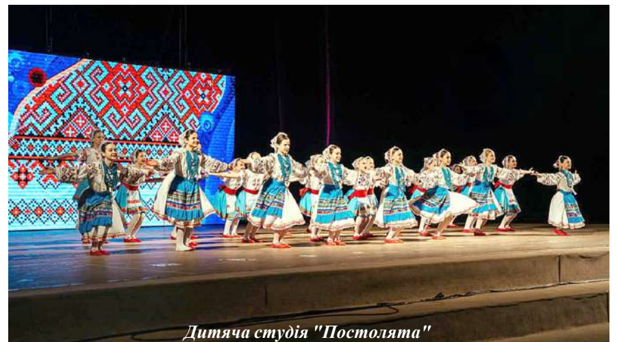
Дитяча студія "Постолята"