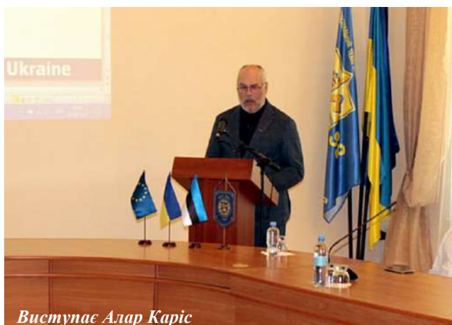
Виступає Алар Каріс

прапорці Європейського Союзу, України та вимпел університету, але й синьо-чорно-білий триколон Естонії: того дня університет відвідував Президент Естонської Республіки Алар Каріс.