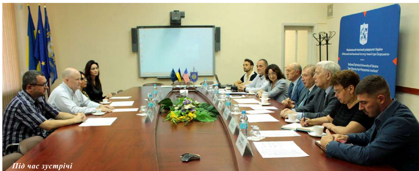
Під час зустрічі