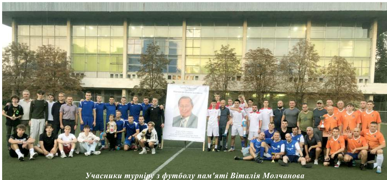
Учасники турніру з футболу пам'яті Віталія Молчанова

Переможці та призери турніру були нагороджені кубками, а всі учасники отримали пам'ятні подарунки.