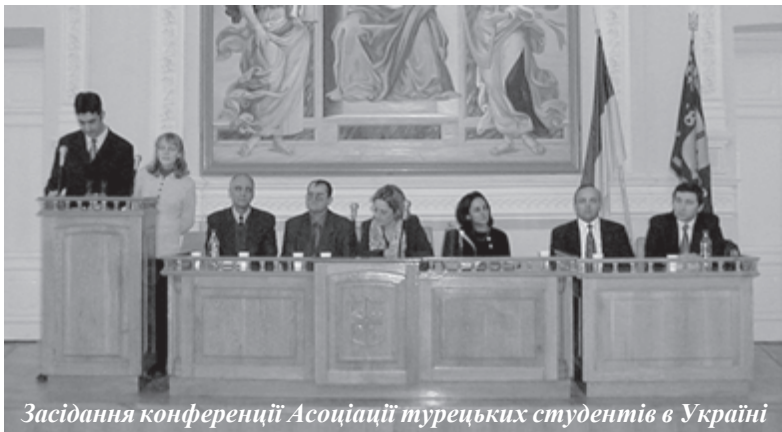
Засідання конференції Асоціації турецьких студентів в Україні