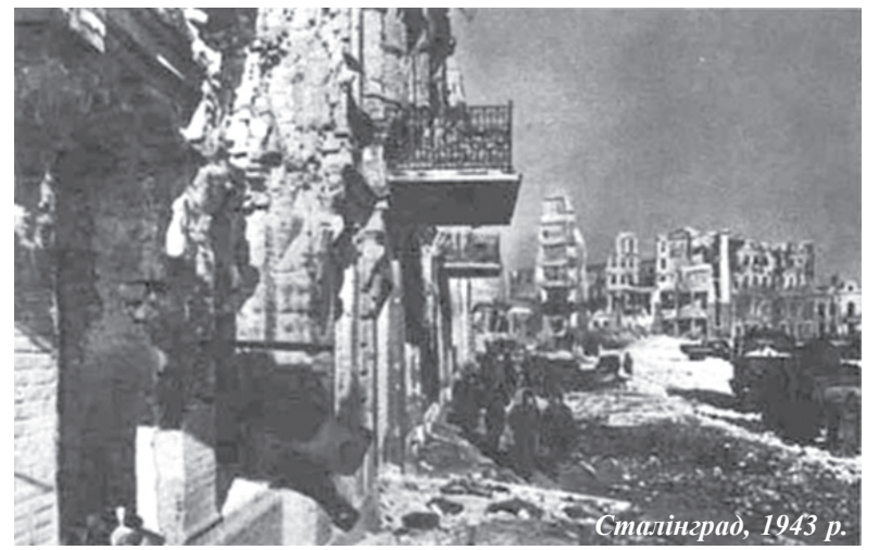
Сталінград, 1943 р.

Сталінградська битва – найбільша операція в Другій світовій війні. Вона внесла вирішальний вклад в досягнення корінного перелому, як в ході Великої Вітчизняної війни, так і всієї Другої світової війни. В цій битві радянські війська вирвали у ворога стратегічну ініціативу й утримували її до кінця війни.