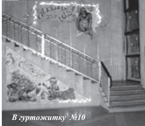
В гуртожитку №10

працюють їх сусіди по кімнатах, що потроху почали їм допомагати і втяглися в роботу. Закінчивши усі найскладніші ремонтні роботи, добралися врешті і до косметичних. Тут уже брались до справи юні художні таланти з ВПФ. Завдяки спільній праці наш колектив став більш дружним. Що ж стосується повсякдення, на своїх підопічних не може жалітися, мабуть тому, що дуже люблю їх, а може через те, що просто немає приводів. У нас у всіх взаєморозуміння, взаємоповага. Ті, хто не бажав прийняти наші умови життя та співпраці, просто виїхали. Чесно кажучи, нелегкими зусиллями ми досягли