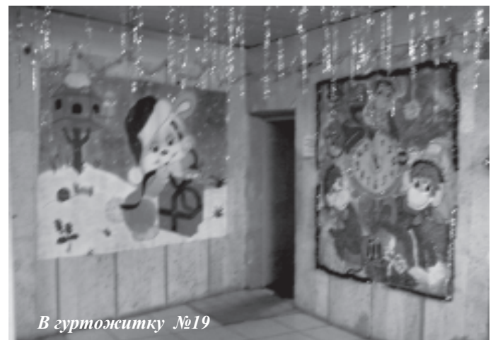
В гуртожитку №19

такі досить високі результати на цьому конкурсі, адже в минулому році наш гуртожитку ледве "дотягнув" до останнього місця, але ми просто знали, що мусимо це зробити і повірили, що зможемо. Ще й зараз немало роботи залишилося. Не сидимо на місці – завжди знайдемо, що зробити. Щось поладити, десь поприбирати, підрихтувати – ми вже просто не можемо сидіти без роботи. До того ж, цей конкурс – неабиякий стимул для нас, адже хочеться бути ще кращими.