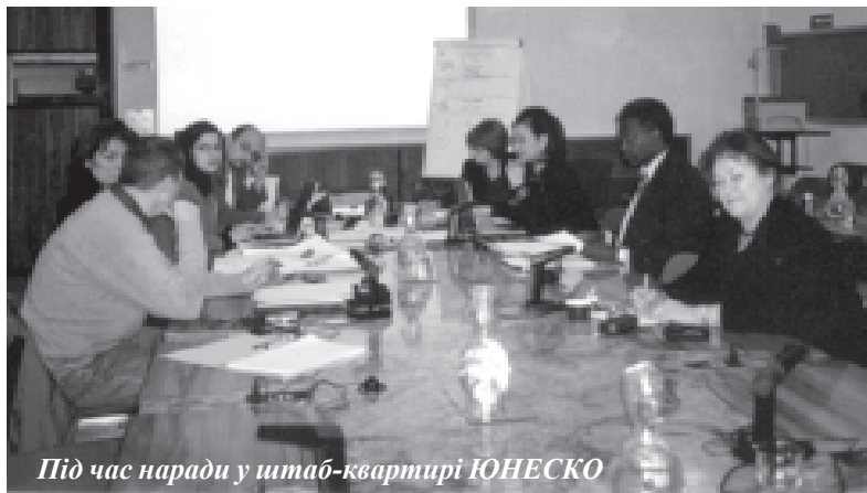
Під час наради у штаб-квартирі ЮНЕСКО