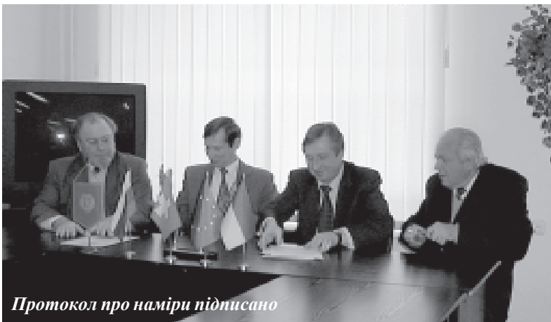
Протокол про наміри підписано