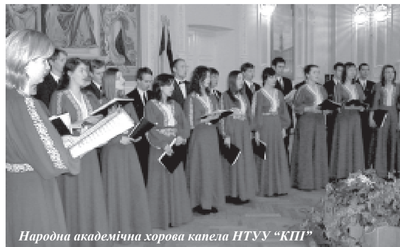
Народна академічна хорова капела НТУУ "КПІ"