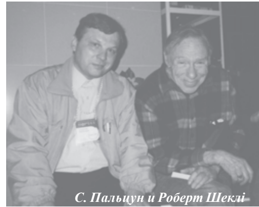
С. Пальцун і Роберт Шеклі