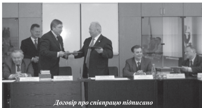
Договір про співпрацю підписано

працюють в ДКБ. Директор також висловив занепокоєння, що останнім часом мало молодих фахівців, зокрема столичних, приходять на підприємство. На "Південмаші" створено Центр аерокосмічної підготовки молоді, де студенти-політехніки, прибіром ФАКСу, зможуть проходити практику і стажування.