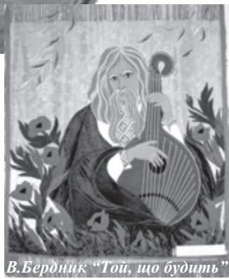
В.Бердник «Той, що будить»

Вперше в університетській галереї демонструвалися картини відомого письменника-фантаста Олесея Бердника і його дружини Валентини Бердник.