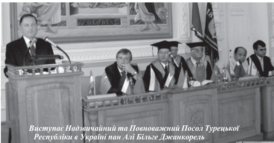
Виступає Надзвичайний та Повноважний Посол Турецької Республіки в Україні пан Алі Більге Джанкорель

років був міністром цивільної авіації Китаю, глава провінції Хай-Нань КНР Лю Сююю – закінчив КПІ у 1959 році. Випускник КПІ 1973 року Янош Кішфалві був Надзвичайним і Повноважним Послом Угорської Республіки в Україні до травня 2003 року.