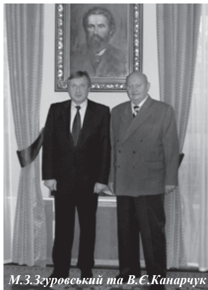
М.Згуровський та В.Є.Канарчук

18 грудня до НТУУ "КПІ" завітав д.т.н., заслужений діяч науки і техніки України, лауреат Державної премії України, колишній ректор Національного транспортного університету Вадим Євгенович Канарчук з чле-