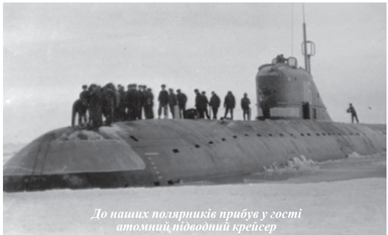
До наших полярників прибув у гості атомний підводний крейсер