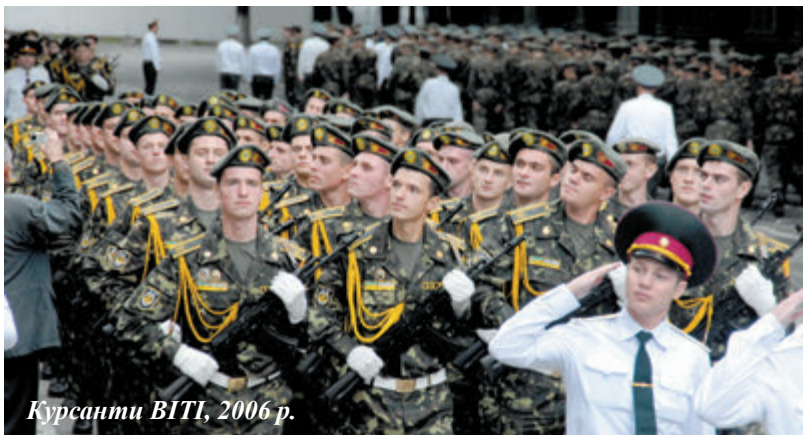
Курсанти ВІТІ, 2006 р.