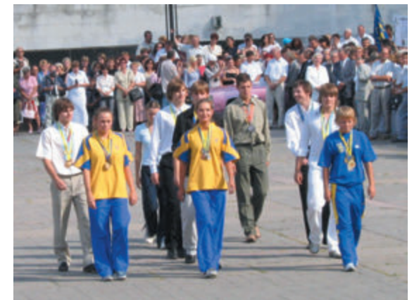
На площі Знань – кращі спортсмени КПІ, 2005 р.