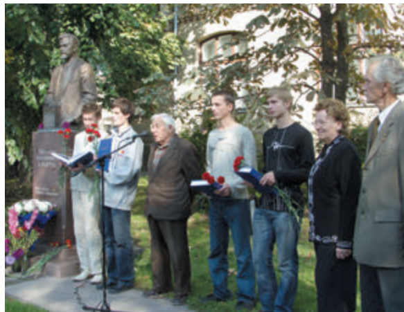
Вшанування пам'яті Михайла Кравчука, 2006 р.