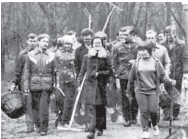
ПОЗИВНИ ЧЕРВОНОЇ СУБОТИ