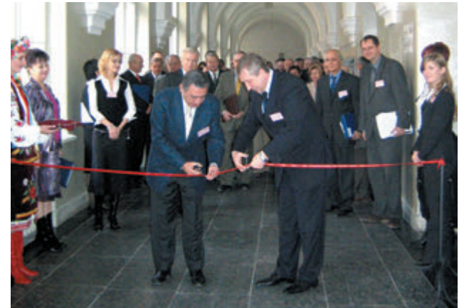
Відкриття Координаційного центру Центрально-східно-європейського віртуального університету CEEVU, 2005 р.