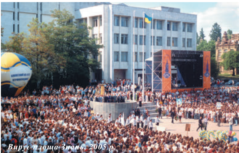
Вирує площа Знань, 2005 р.