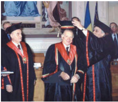
Нобелівський лауреат Жорес Алфьоров – Почесний доктор НТУУ «КПІ», 2004 р.

На цій сторінці представлено фото, що публікувалися в нашій газеті остан-німи роками. На них – життя Київського політехнічного, наша сучасна історія. Перегляньте їх, поміркують – і погодьтесь, що історія, яку ми разом творимо в Київському політехнічному, – це дійсна історія, що події, які відбуваються у нас, закладають основи майбутнього, причому не тільки нашого університе-ту, а й усієї України. І приходьте до редакції – щоб не тільки творити, а й писати історію.