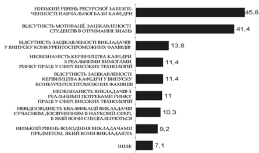
Діаграма 7. Розподіл відповідей респондентів на запитання: "Що заважає кафедрі, на якій ви навчаєтесь, забезпечувати високий рівень вашої підготовки за вищезазначеними складовими"