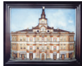
Міська дума, Київ, 1876 р.

Й.Б.Осташицький також займається благодійністю. Разом з Київсь-