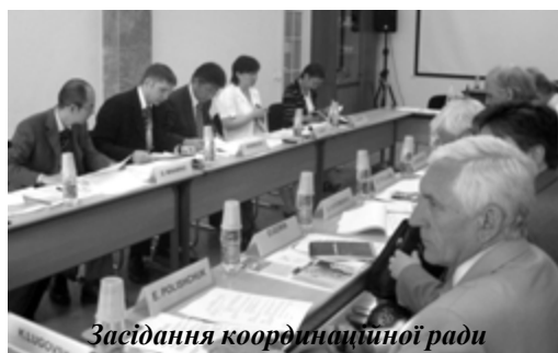
Засідання координаційної ради

Позитивні інтереси до України зі сторони японських колег викликані кількома причинами. По-перше, вступ України до ВТО надає набагато ширші можливості для інвестування. По-друге, стратегічне географічне положення України (між Західною Європою і Росією, де Японія має свої бізнес-інтереси) дозволяє бути їй транзитною державою, використовуючи свої чорноморські порти та транспортні магістралі. Тобто, Одеса може стати новим Роттердамом. По-третє, очікуване подальше вдосконалення української інфраструктури приваблює не тільки торгові компанії, а й самих товаровиробників. Ще один аргумент – збільшення сумарних витрат на ве-