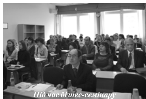
Під час бізнес-семінару

Таким чином, відзначаючи свою другу річницю, Українсько-японський центр розробляє нові програми та прагне шляхом поширення в Україні японського досвіду зробити свій внесок у розвиток вітчизняної економіки.