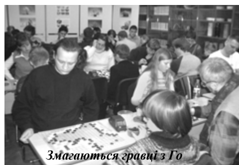
Змагаються гравці з Го